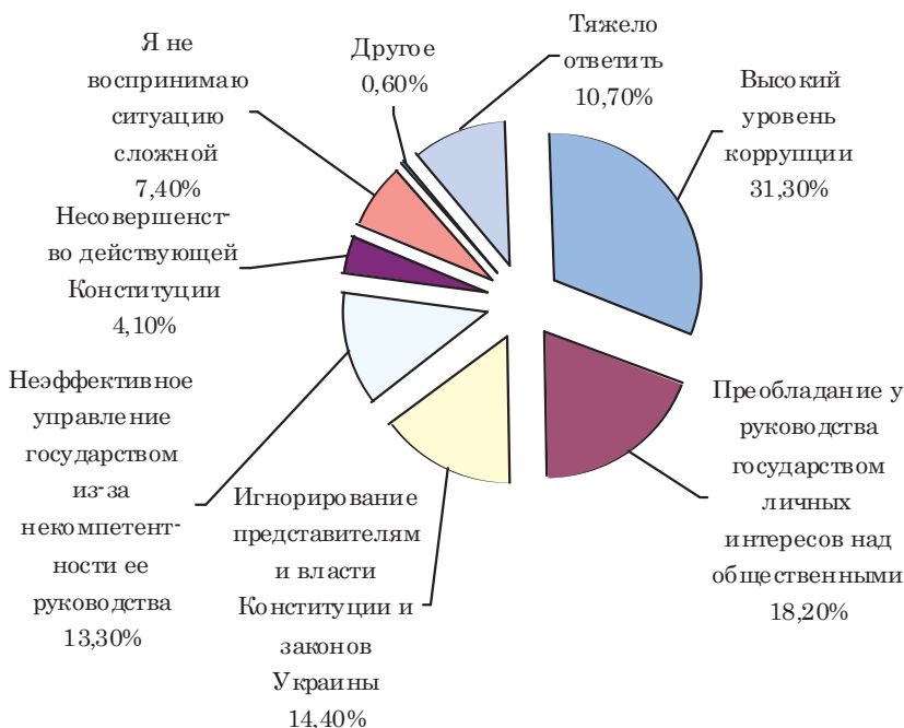
Рис. 1. Результаты исследования на тему: «Какова главная основная причина сложной социально-экономической и политической ситуации в Украине?», построено по данным [5]

С целью изучения общественного мнения на тему: «Какова главная основная причина сложной социально-экономической и политической ситуации в Украине?», с 31 мая по 6 июня 2012 г. социологической службой Центра Разумкова было проведено масштабное исследование. В рамках исследования было опрошено 2009 респондентов старше 18 лет во всех областях Украины, Киеве и АР Крым по выборке, представляющей взрослое население Украины по основным социально-демографическим показателям. Теоретическая погрешность выборки (без учета дизайн-эффекта) не превышает 2,3% с вероятностью 0,95. Результаты опроса проведены на рис. 1.