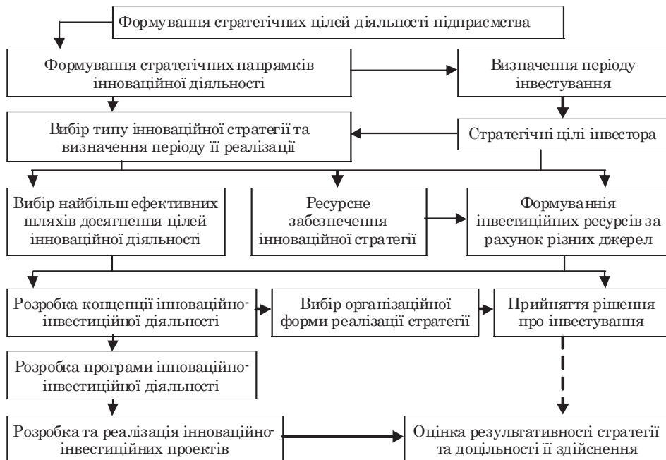
Рис. 1. Основні етапи формування інноваційно-інвестиційної стратегії підприємства [4]