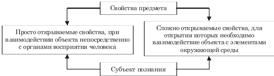
Рис. 1. Двойственность путей открытия свойства для субъекта, авторская разработка

Согласно определению, даваемому Большой советской энциклопедией, свойства предмета являются субъекту (человеку) сами по себе. Кроме того, некоторые свойства проявляются при взаимодействии предмета с другими предметами или объектами. Рис. 1 показывает двойственность способа открытия свойств для субъекта.