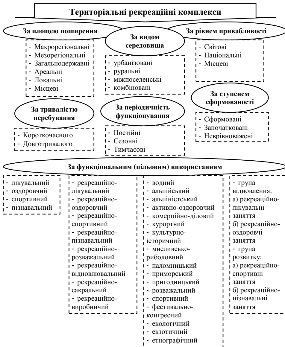
Рис. 2. Типізація рекреаційних комплексів, складено на підставі [5; 7; 11]

Таке зонування територій сприятиме формуванню якісно нової стратегії економічного, соціального та екологічного розвитку рекреаційних територій. І в першу чергу, аспекти зонування повинні бути відображені у методиках та порядку оцінки відповідних земель. Розглядаючи економічну складову розвитку територій, варто зауважити, що земельні ресурси є джерелом наповнення державних бюджетів як ресурс, за який справляється плата за користування та податок, що вимагає досконалого механізму диференціації.