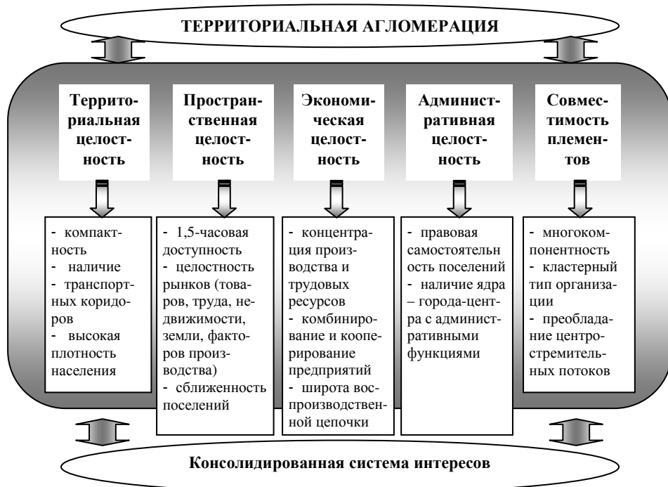
Рис. 2. Классификация признаков территориальной агломерации, авторская разработка

Исследование процессов формирования территориальной агломерации проведено на примере Ярославской области, типичного старопромышленного региона Европейской части России.