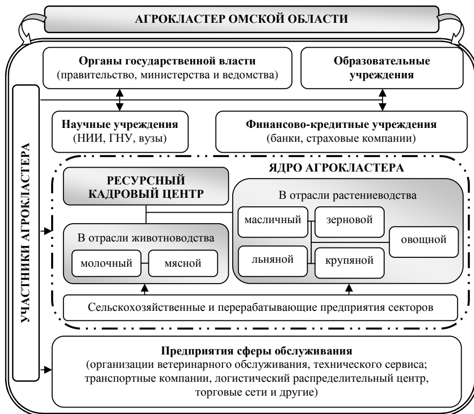
Рис. 1. Структура агрокластера Омской области, авторская разработка

Однако следует отметить, что кластерное развитие АПК региона затруднено из-за накопившихся социально-экономических, политических и институциональных проблем на селе, процессов миграции и депопуляции населения, дефицита квалифицированных кадров. Наблюдается перенасыщение специалистов одного профиля и недостаточная подготовка специалистов по дефицитным профессиям, специальностям.