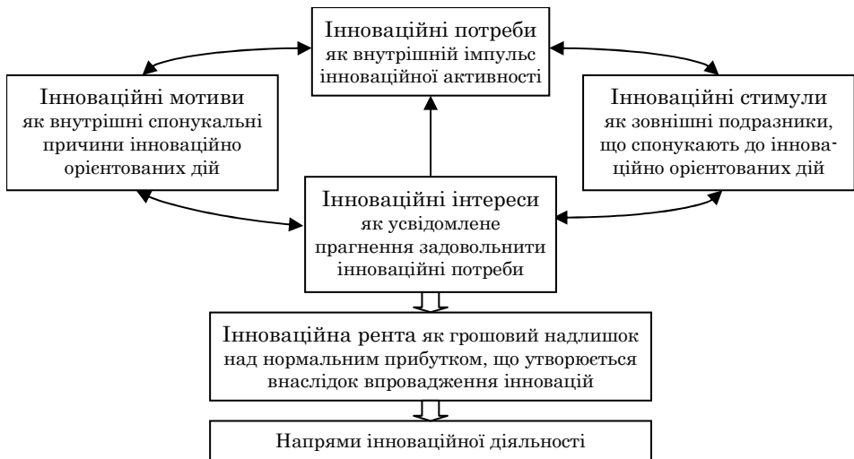
Рис. 1. Взаємозв'язок інноваційних потреб, мотивів, стимулів та інтересів підприємництва, авторська розробка

Усвідомлені інноваційні потреби кожного конкретного підприємства набувають форми інноваційних інтересів і виступають об'єктивним спонукальним мотивом інноваційної діяльності (рис. 1).