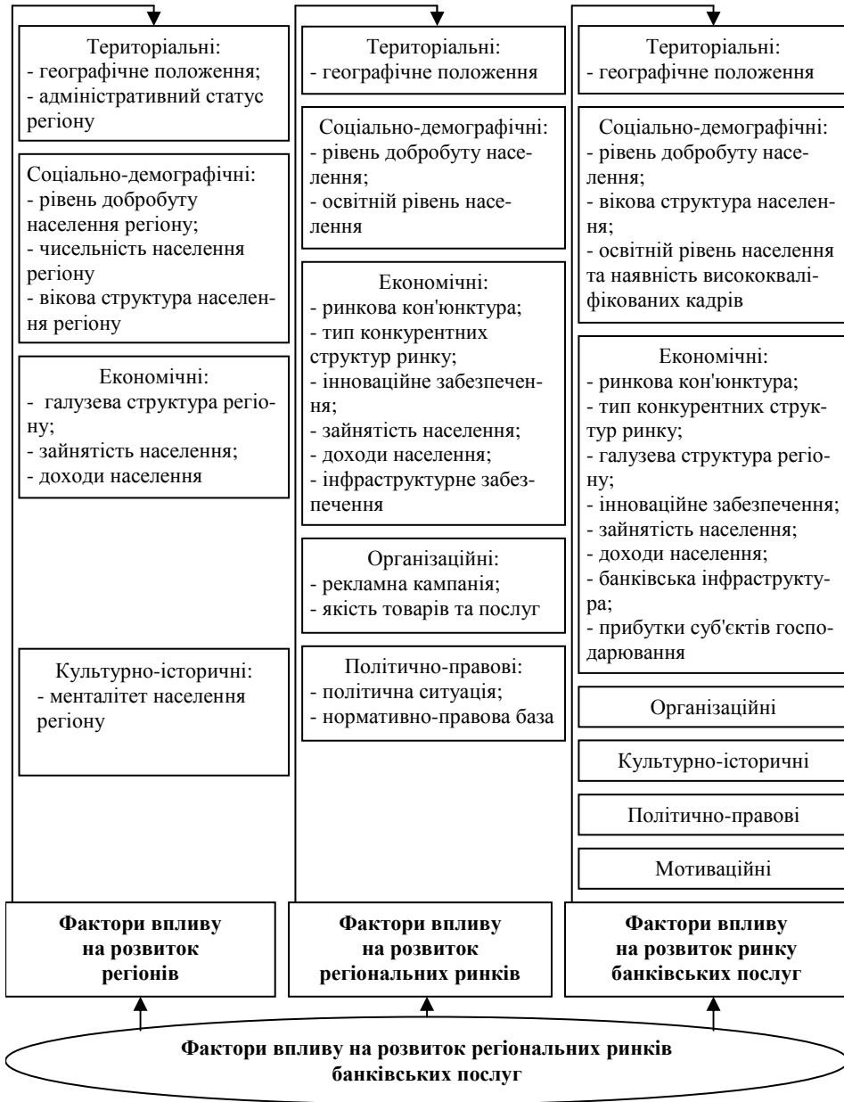
Рис. 2. Фактори впливу на розвиток регіональних ринків банківських послуг, авторська розробка

ринок банківських послуг. При трактуванні поняття «ринок банківських послуг» вчені в більшій мірі зосереджувалися на макрорівні. Під регіональним ринком банківських послуг розуміється сукупність соціально-економічних взаємовідносин між суб'єктами ринку, які формуються на просторово упорядкованих територіях – регіонах, під дією законів попиту та пропозиції, що