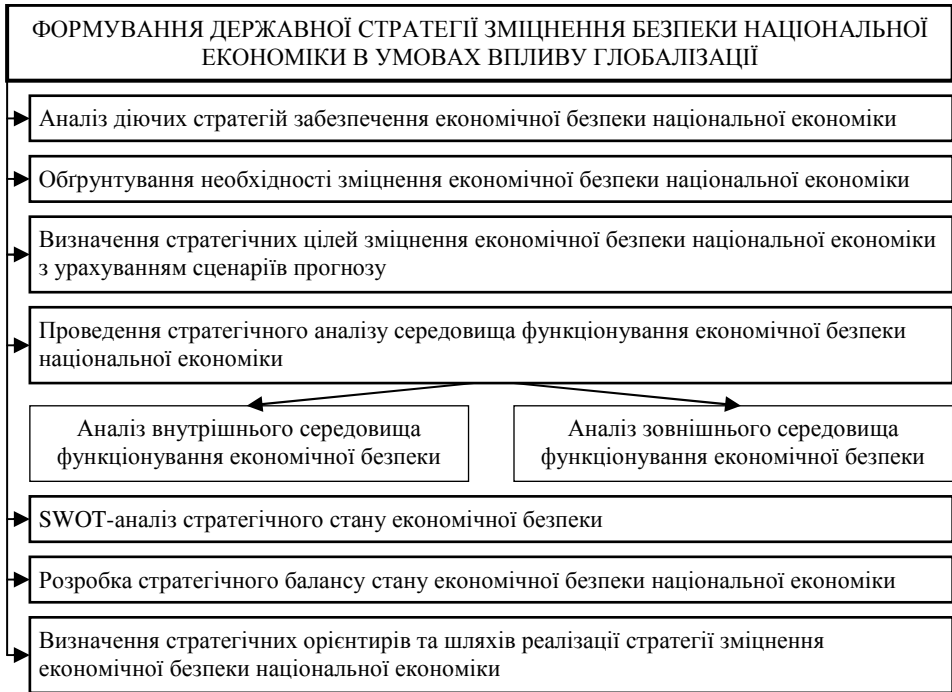
Рис. 1. Послідовність процесу формування державної стратегії зміцнення безпеки національної економіки в умовах впливу глобалізації, авторська розробка

З рис. 1 видно, що процес формування державної стратегії зміцнення безпеки національної економіки з урахуванням впливу глобалізації передбачає реалізацію 8 послідовних етапів. Спочатку проводиться пошук і порівняльний аналіз існуючих державних стратегій, пов'язаних із зміцненням економічної безпеки. Стратегічний аналіз зовнішнього й внутрішнього середовищ функціонування економічної безпеки національної економіки, а також аналіз сильних і слабких сторін, можливостей і загроз є базою для визначення стратегічних альтернатив та пріоритетів зміцнення економічної безпеки з урахуванням впливу глобалізації. Реалізація розробленої державної стратегії передбачає визначення відповідальних органів державної влади й безпосередніх виконавців стратегічних заходів в сфері підсилення захищеності вітчизняного виробника та бізнесу від загроз та в цілому зміцнення економічної безпеки національної економіки. У цьому контексті дуже важливими є такі моменти: дієвість в цьому напрямі владних структур і спрямування спільних зусиль влади й бізнесу; фінансове забезпечення необхідних структурно-логічних трансформацій для підвищення конкурентоспроможності економіки.