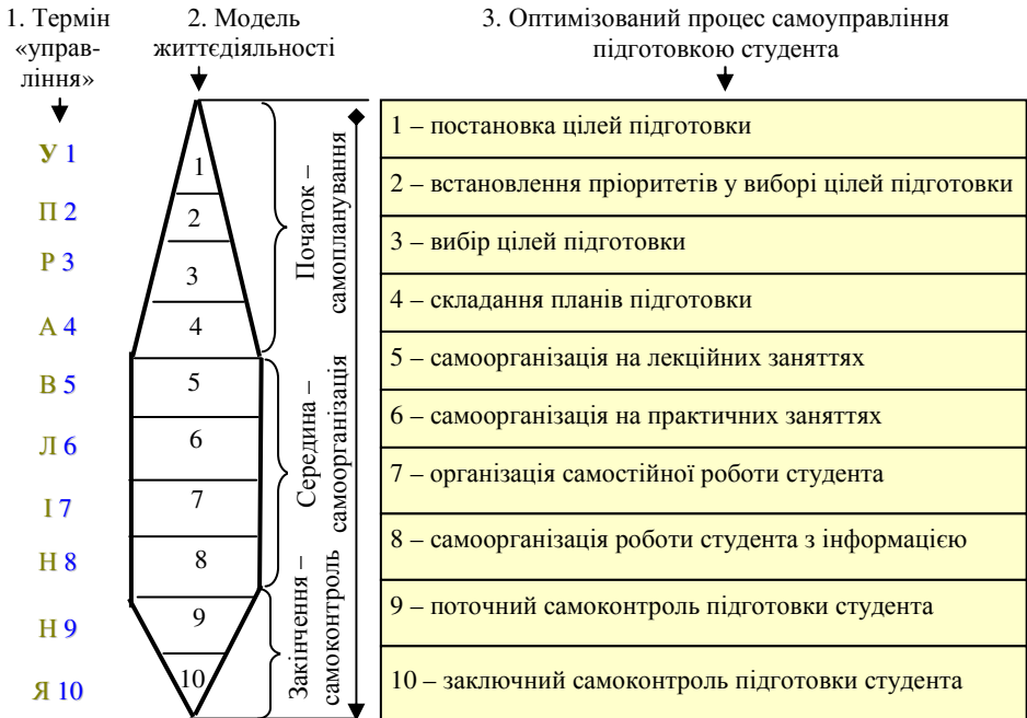
Рис. 2. Концептуальна модель творчого самоуправління процесом підготовки студента, авторська розробка