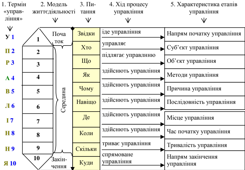
Рис. 1. Фундаментальна модель творчого управління соціальними процесами [3]