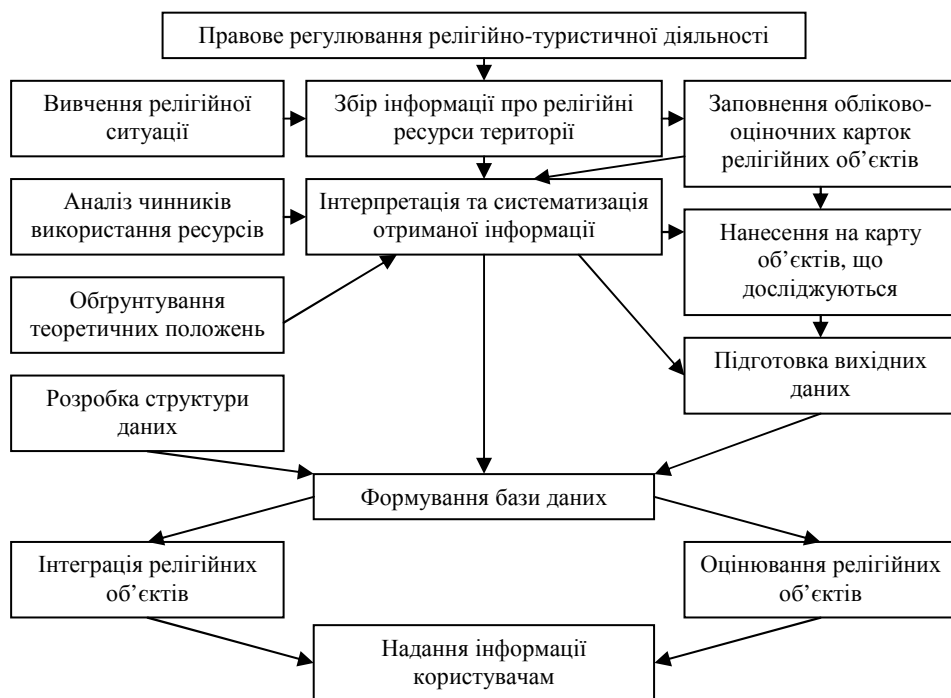
Рис. 1. Тематичний (релігійний) блок даних регіональної туристично-інформаційної системи, авторська розробка

моделей сакральнo-туристичного продукту та додаткових туристичних (конкретно-дестинаційних) послуг тощо.