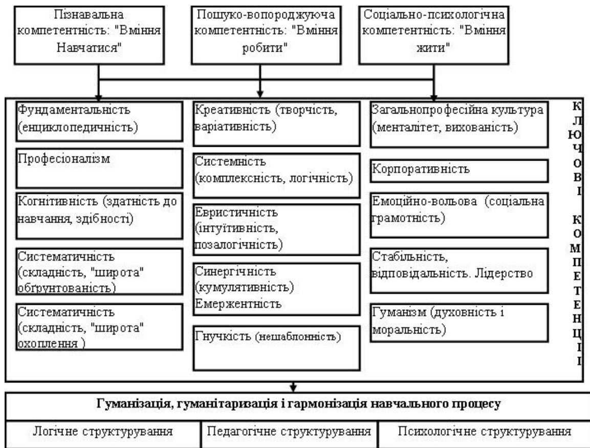
Рис. 3. Структура моделі сучасного менеджера з природоохоронної діяльності

єдність інтелектуального розвитку з формуванням особи, здатність справлятися з суперечностями й невизначеністю життєвого досвіду; здатність самостійно контролювати хід свого інтелектуального розвитку і досягати висот професійної майстерності і творчості; структуризація знань, ситуативно-адекватна актуалізація знань, розширення, нагромадження знань, спрямованих на заощадження ресурсів, екологічну безпеку; адекватна оцінка досягнутих у саморозвитку результатів і постановка нових перспективних завдань з розвитку екологічних знань і технологій управління.