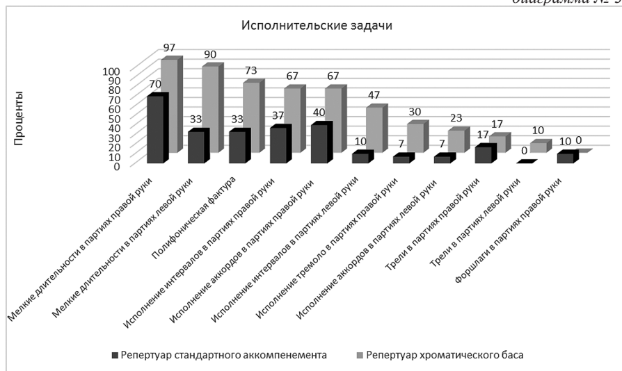
диаграмма № 3.

Технические трудности исполнения для разных типов инструментов распределены неравномерно. Можно отметить одну тенденцию: почти все они касаются репертуара хроматического баса. Это объясняется не только более совершенной в плане музыкальной выразительности левой клавиатуры, но и влиянием развития исполни-