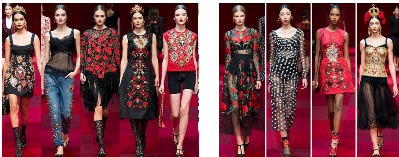
Рис. 3, 4. Колекція Dolce&Gabbana (сезон весна-літо 2015)

2013 року бренд Dolce & Gabbana створив колекцію одягу, в якій домінуючими елементами декору була українська вишивка. Одяг завоював відомих модниць і весь світ різко зацікавився традиціями української культури.