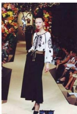
Рис. 1. Модель Ів Сен Лоран в етностилі