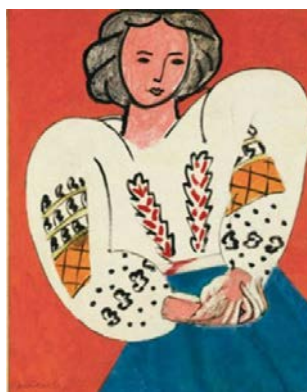
Рис. 2. Картина Матісса «Румунська блузка»

Японський дизайнер Кензо також деякою мірою вплинув на формування основних критеріїв етностилю. Він поєднував південноамериканські, східні та скандинавські елементи з простим покроєм кімоно. Модельєр застосував індійську пайджаму, російські косоворотки, індіанські бахрому, хутрянні шапки - ці всі його експерименти призвели до злиття класичного або спортивного стилю з мотивами та елементами «Етно».