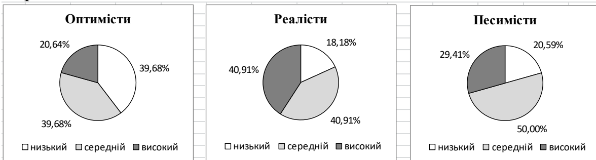
Рис. 3. Рівні деперсоналізації педагогічних працівників ЗНЗ для розумово відсталих учнів з різним психологічним типом особистості

Достовірні відмінності між педагогічними працівниками з різним типом особистості (оптимістами, реалістами та песимістами) отримані також за показником деперсоналізація. Наочно результати представлені на рис. 3.