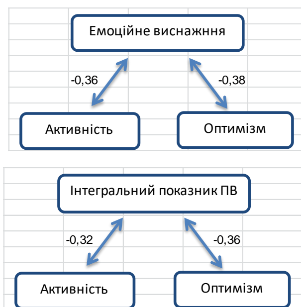
Рис. 4. Значимі кореляційні зв'язки показників професійного вигорання та оптимізму й активності

Наочно значимі коефіцієнти кореляції показників професійного вигорання з оптимізмом і активністю представлені на рис.4.