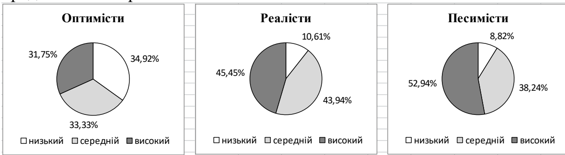
Рис. 2. Рівні емоційного виснаження педагогічних працівників ЗНЗ для розумово відсталих учнів з різним психологічним типом особистості

особистості (оптимістів, реалістів та песимістів). Наочно результати представлені на рис. 2.