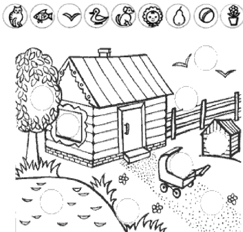
Рис. 2 Стимульний матеріал до методики "Де чие місце?".

Біля всіх зображених предметів розташовані порожні кружечки. Для гри також знадобляться такі ж за величиною кружечки, але вже з намальованими на них фігурками. Всі зображені в кружечках фігурки мають своє певне місце на картинці.