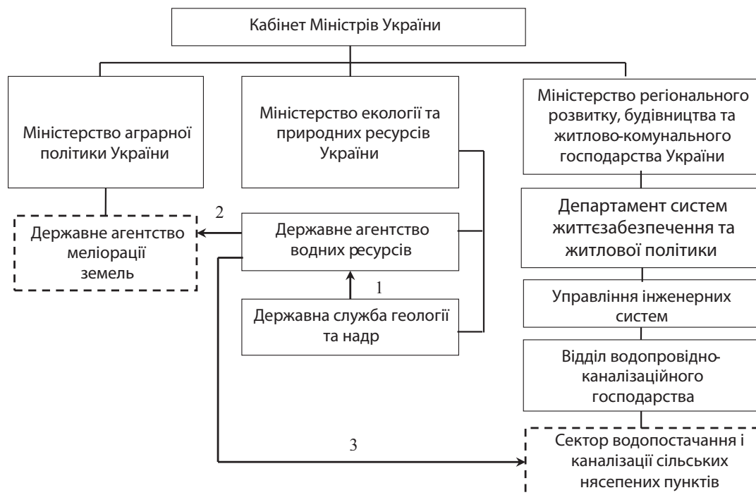
Рис. 3. Схема передачі повноважень та вдосконалення організаційної структури державного управління в водній сфері:

У п. 3 Положення про Міністерство регіонального розвитку, будівництва та житлово-комунального господарства (Мінрегіон) засвідчено, що одним із його основних завдань є забезпечення реалізації державної політики щодо благоустрою населених пунктів, ...питної води та питного водопостачання, а в організаційній структурі Міністерства є Відділ водопровідно-каналізаційного господарства при Управлінні інженерних систем