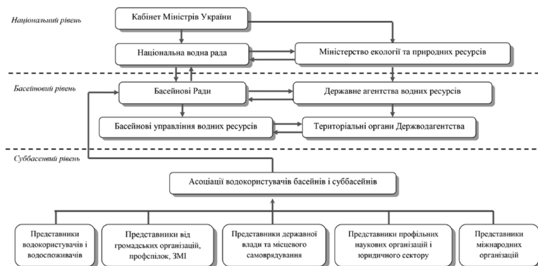
Рис. 1. Схема реорганізації управління водними ресурсами в Україні на національному рівні

Головою ради доцільно призначити представника Кабінету Міністрів України, наприклад із секретаріату, віце-головами міністрів міністерств, що мають пряме відношення до водних ресурсів – Міністра Мінприроди, Голову Держводагентства, Міністра Мінагрополіти-