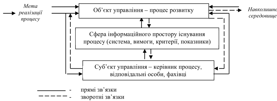
Рис. 1. Блок управління процесами розвитку

Узагальнена модель механізму управління процесами розвитку ілюструє упорядковані зв'язки, взаємодії суб'єкта управління (керівника процесу) з його виконавчими ланками на основі упорядкування зв'язків під