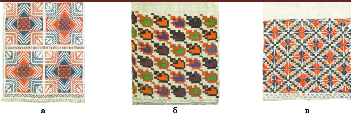
Рис. 5 – Сітчасто-рапортна композиція подільського рушника: а – квадратна; б – прямокутна; в - ромбовидна

На основі вивчення всіх доступних орнаментів було сформульовано певні правила побудови таких багатоярусних структур: