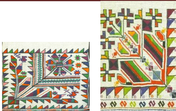
Рис. 2 – Монорапортна композиція подільського рушника з асиметричним рішенням