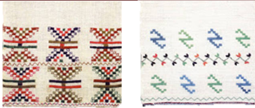
Рис. 7 – Подільський рушник з орнаментальною стрічкою

У вишивці Поділля можна виділити також певні орнаментальні структури, які поєднують два і більше елементів. Часто трапляються структури, утворені S (латинське S) і косою хрестика – X (рис. 7).