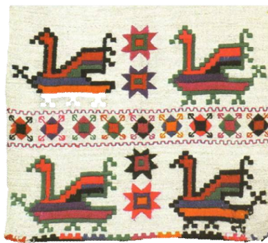
Рис. 6 – Подільський рушник з вертикальною розмежувальною орнаментальною стрічкою

Особливе місце в структурі візерунка подільського рушника посідає базова орнаментальна стрічка, яка відокремлює основний образ від краю рушника. Вона наявна не лише в лінійно-рапортних («ярусних») орнаментах, але й у монорапортних композиціях.