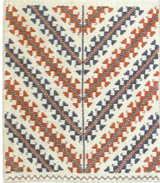
Рис. 3 – Монорапортна композиція подільського рушника симетричного рішення з трансляцією і певним числом рапортів

До другого типу подільського рушника можна віднести рушники з лінійно-рапортною композицією, в якій обов'язковою умовою є вісь симетрії (рис. 4). Це рушники з кількарядовим повторенням по горизонталі однакового мотиву. Умовно можна назвати таку структуру одноярусною (рис. 4, а).