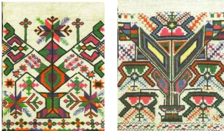
Рис. 1 – Монорапортна композиція подільського рушника з симетричним рішенням без трансляції

До монорапортних композицій подільського рушника можна віднести і окремо виконаний мотив. Це може бути дерево, зірка чи інша орнаментальна структура. Рушник у цьому випадку сприймається як цілісний образ, «картинка», візерунок якого складається з елементів які доповнюють один одного, утворюють єдину структуру. Такий образ додатково обрамлявся по периметру зірками або іншою орнаментальною стрічкою з метою підкреслення його цілісності.