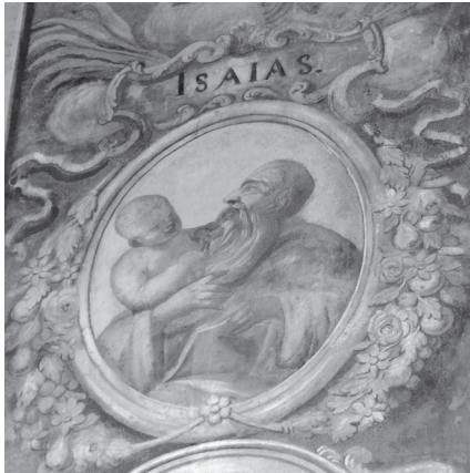
Б. Мазуркевич. Пророк Ісая. Композиція на східному стовпі північної нави. Малярство після реставрації. Публікується вперше.