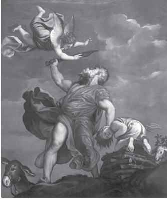
В. Тиціан. Жертва Ісаака (полотно, олія). Композиція виконана у 1542–1544 р. і міститься в Санта Марія делла Салюте у Венеції