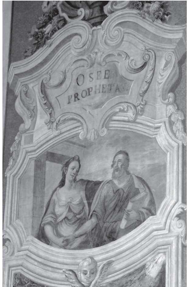
Б. Мазуркевич. Пророк Осія разом з жінкою Гомер. Композиція у північній наві. Малярство після реставрації. Публікується вперше.

Доповненням старозаповітних мотивів є також інскрипції на розгорнутих сувоях паперу, які тримають ангели, зображені на склепіннях прясел притвору. Написи закликають вірних до каяття в гріхах та навернення до Бога. Поряд на плафонах прясел бабинця розміщені також цитати з Нового Заповіту та з творів отців церкви на ту саму тематику, в більшій або меншій мірі змінені пізнішими перемалюваннями. У північному пряслі цитовано уривок з Біблії в латинському перекладі (Вульгати), з Книги премудрості Сина Сирахового: « Si Paenitentiam non egerimus incidemus in manus... ». В оригіналі читаємо: « Dicentes si paenitentiam non egerimus incidemus in Dei manus et non in manus hominum » («Говорячи: Якщо покутувати не будемо, попадемо в руки Божі, а не в руки людські») (Сир.: 2, 22). На склепінні прясла південної частини притвору зображений картуш з написом, що є фрагментом з Книги Юдифі (8, 14): « Sed quia patiens est Dominus in hoc ipso paeniteamur et indulgentiam eius lacrimis postulemus » («Але що Господь є терпеливим і за це покутуймо і пробачення його, сльози виливаючи, бажаємо»).