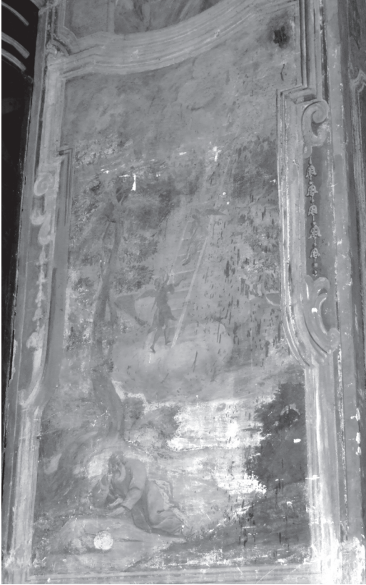
Б. Мазуркевич. Драбина Якова. Композиція на першому від сходу стовпі південної нави. Сучасний стан малярства. Публікується вперше.