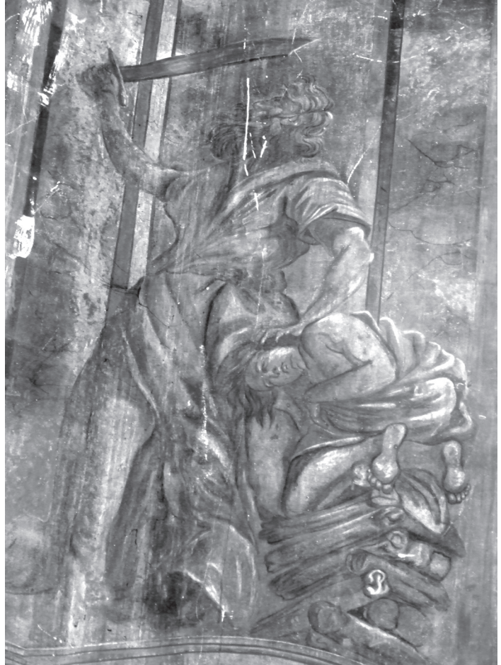
Б. Мазуркевич. Жертва Ісаака. Композиція на південній стіні пресбітерію. Сучасний стан малярства. Публікується вперше.

і сиджу посеред народу нечистогостого, а очі мої бачили Царя, Господа Саваота! І прелетів до мене один з Серафимів, а в руці його вугіль палаючий, якого він узяв щипцями з-над жертівника. І він доторкнувся до уст моїх та й сказав: Ось доторкнулося це твоїх уст, і відійшло беззаконня твоє, і гріх твій окуплений » (Ісаїя: 6, 5–7).