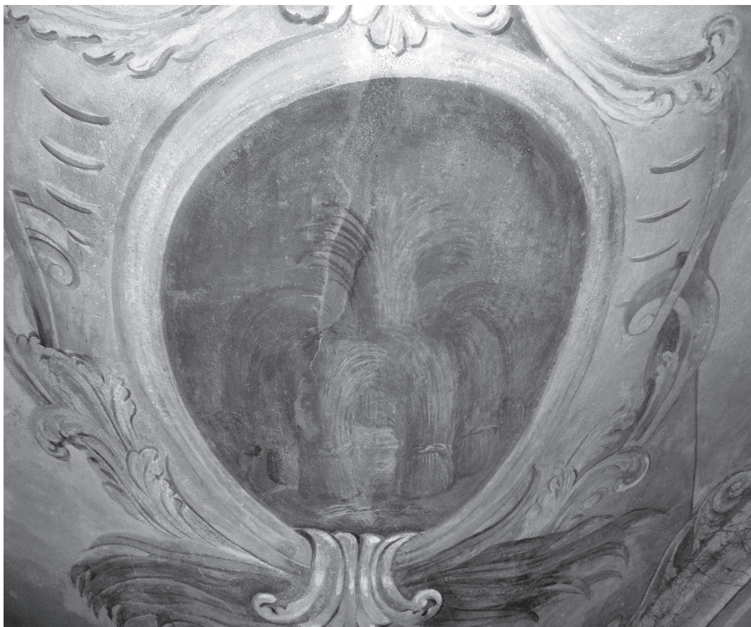
Б. Мазуркевич. Шість снопів кланяються сьомому. Зображення на склепінні західного прясла південної нави. Сучасний стан малярства. Публікується вперше.

почерпнуті з пророчих снів Йосипа Єгипетського, які він розповів своїм братам, чим викликав їхні заздрощі. «І сказав він до них: Послухайте-но про той сон, що снувся мені. А ото ми в'яжемо снопи серед поля, і ось мій сніп зачав уставати, та й став. І ось оточують ваші снопи, та й вклоняються снопові моему » (Буття: 37, 6–7). «І снувся йому ще сон інший, і він оповів його братам своїм, та й сказав: Оце снувся мені ще сон, і ось сонце та місяць та одинадцять зір вклоняються мені » (Буття: 37, 9).