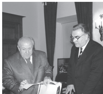
Віце-президент АМУ Ігор Безгін в гостях у президента РАХ Зураба Церетелі

Своє 250-річчя Російська академія художеств відзначає неабияким науково-творчими і педагогічним успіхами, у неї велике майбутнє, вона успішно співпрацює з багатьма зарубіжними митцями, науковцями, творчими закладами, у тому числі з нашими діячами культури та Академією мистецтв України. Слід сподіватися, що наші науково-творчі зв'язки зміцнюватимуться та розширюватимуться.