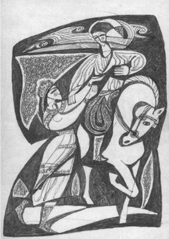
О. Заливаха Із серії «Лажерна графіка» (1965-1966)

О. Заливаха надавав великого значення змістові художнього твору [15]. Наголошував, що «основа справжнього мистецького твору великого лету полягає в сакральності, ...навіть митець молився і постився перед початком творчого акту... Віра, взята у чужинця, не спасає, а губить... Ще і в Шевченка зазначено: коли в своїй хаті — своя правда, і сила, і воля. А для монументального мистецтва властива символіка». Опанас Заливаха був переконаний, що в основі всього лежить філософсько-естетичне осмислення в символах себе і свого місця у Всесвіті» [17, с. 46–47].