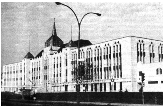
В. Томашевський. Католицька духовна семінарія. Монреаль, 1958