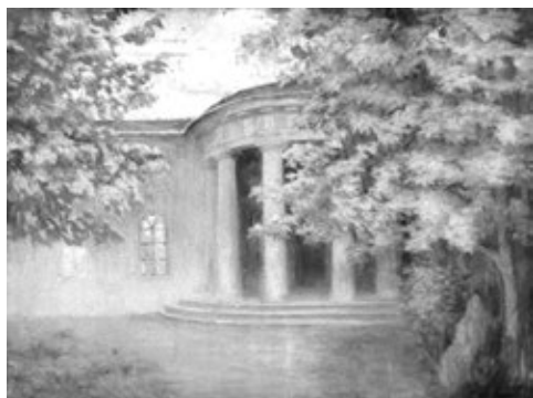
О. Стіліануді. Дача Маразлі. Полотно, олія. 75 x 90