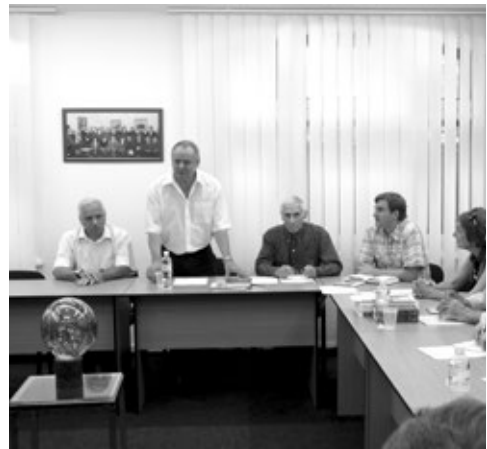
Круглий стіл «Григорій Сковорода і сучасний контекст».

очоловав Національний художній музей України, чотири рази обирався відповідальним секретарем правління Національної спілки художників України. Його твори експонувалися більш ніж на 100 вітчизняних та зарубіжних виставках, у тому числі в Бельгії, Болгарії, Голландії, Іспанії, Італії, Канаді, Німеччині, Польщі, Румунії, Словаччині, США, Чехії, Угорщині, країнах колишньої Югославії. Роботи художника зберігаються у багатьох музеях України, Болгарії, Канади та приватних зібраннях.