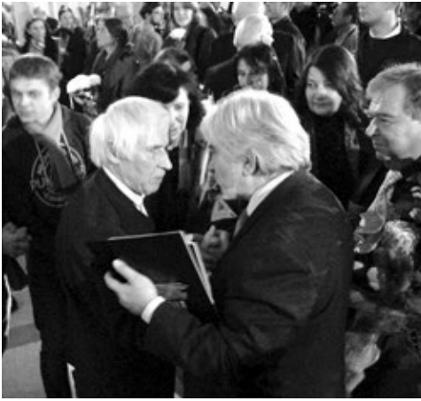
Презентація живописної композиції М. Стороженка «Передчуття Голгофи».