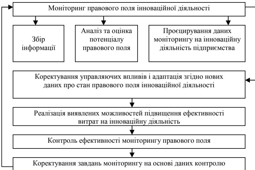
Рис. 2. Алгоритм моніторингу правового поля інноваційної діяльності промислового підприємства