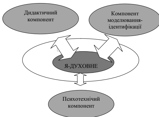
Рис. 2. Складові процесу формування Я-духовного як складової Я-концепції

Їх поєднання уявляється нами так, як показано на рисунку № 2.