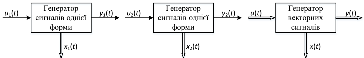
Рис. 1. Генерація двох повідомлень.

Розглянемо систему, яка генерує два вихідних повідомлення y_1(t) та y_2(t) (рис. 1).