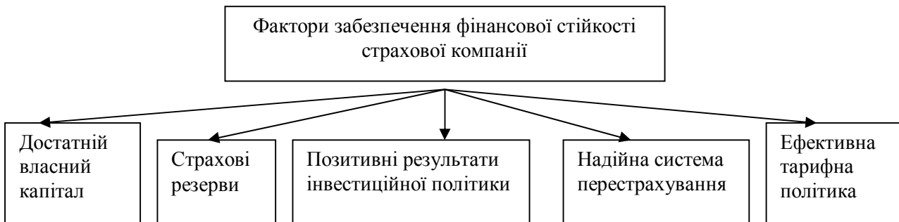
Рис. 1. Фактори забезпечення фінансової стійкості страховика

Результати. Проведені дослідження свідчать, що під фінансовою стійкістю страхових операцій розуміють постійну збалансованість або перевищення доходів над витратами страховика в цілому по страховому фонду [1]. Фактори, що забезпечують фінансову стійкість страхової компанії, подані на рис. 1.