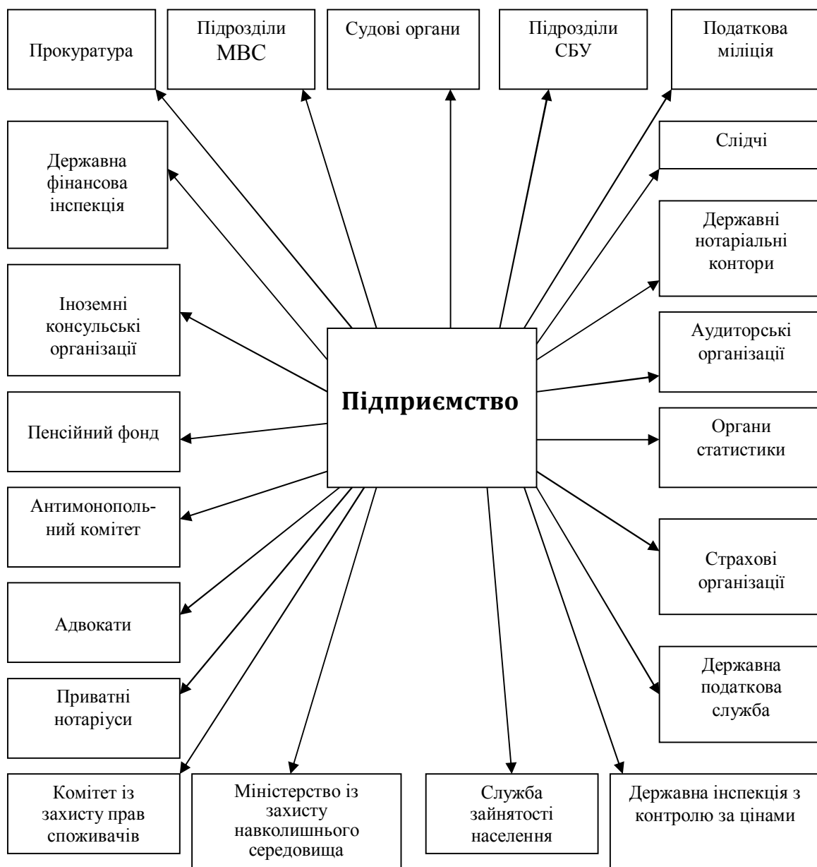
Рис. 2. Структура інформаційних взаємовідносин підприємства

ційну таємницю. Аналіз правової бази України, що регулює доступ до комерційної таємниці, дозволяє стверджувати, що в цьому напрямі є безліч прогалин як законодавчого, так й організаційно-економічного характеру.