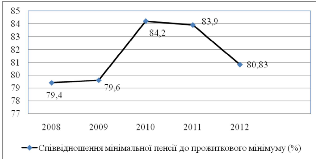
Рис. 2. Співвідношення мінімальної пенсії до прожиткового мінімуму протягом 2008–2012 рр.

Уже у 2012 році, за попередніми підрахунками, спостерігається позитивна тенденція й досліджуваний показник становить 46,6%. Для порівняння: в Італії та Іспанії він становить 90%, Швеції й Німеччині – 65%, Франції, Японії, США – 50%. Як не парадоксально, але за формальними показниками вітчизняна пенсійна система виглядає на тлі інших країн цілком пристойно. Іншими словами, Україна має хоч і менший, але цілком порівняльний показник.