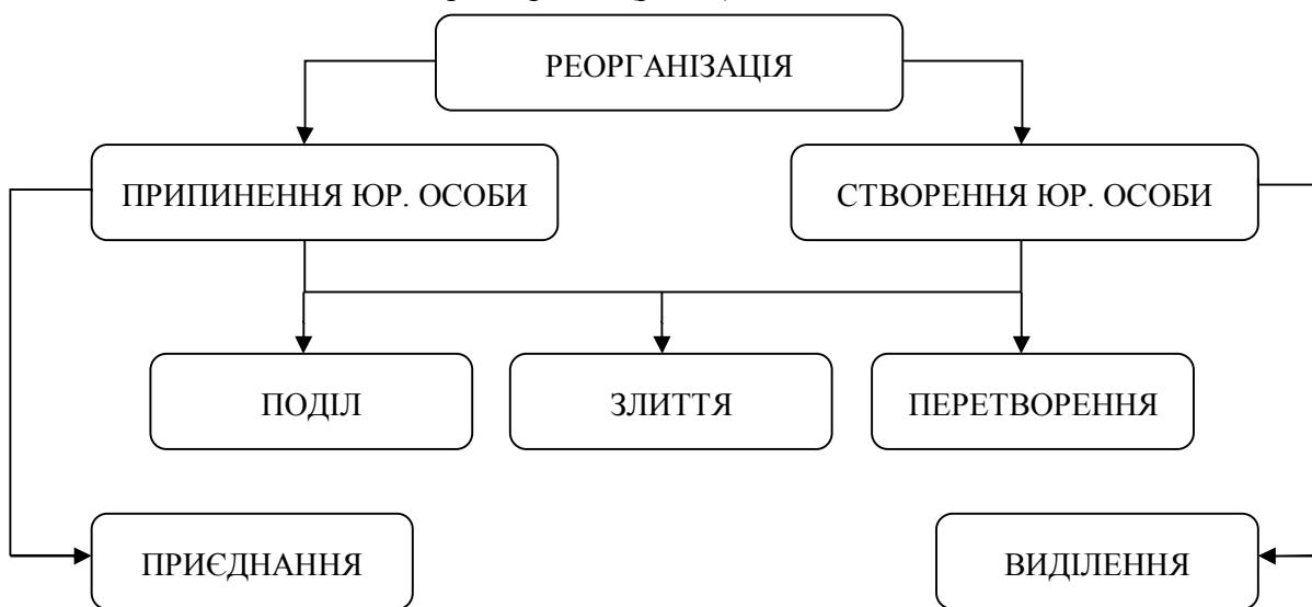
Рис. 1. Види реорганізації за суттю її поняття

Відповідно до аналізу законодавчо-нормативних актів, реорганізацію юридичної особи з метою створення іншої юридичної особи можна провести в такий спосіб: виділення, поділ, злиття та перетворення (рис. 1).