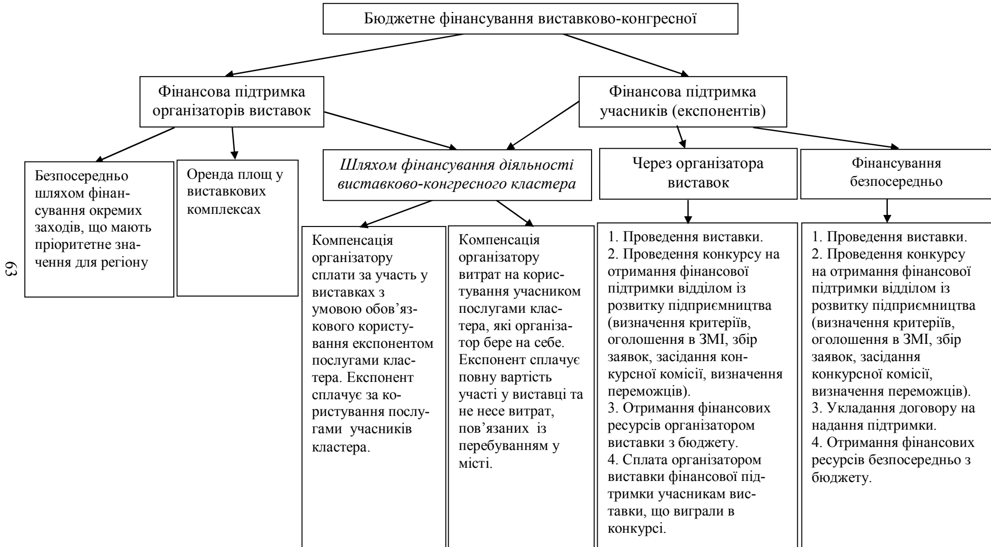
Рис. 2. Механізми бюджетного фінансування виставково-конгресної діяльності