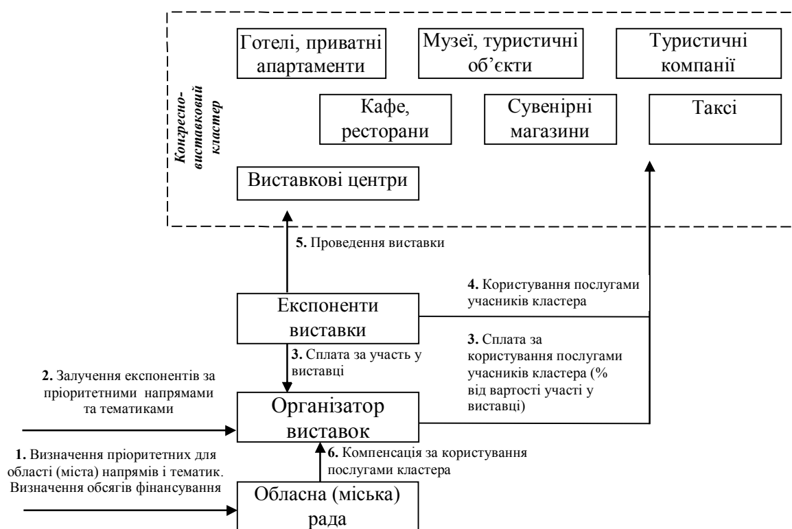
Рис. 5. Принципова схема роботи виставково-конгресного кластера з бюджетним фінансуванням; розроблено автором

Висновки. Проведені дослідження дозволили: