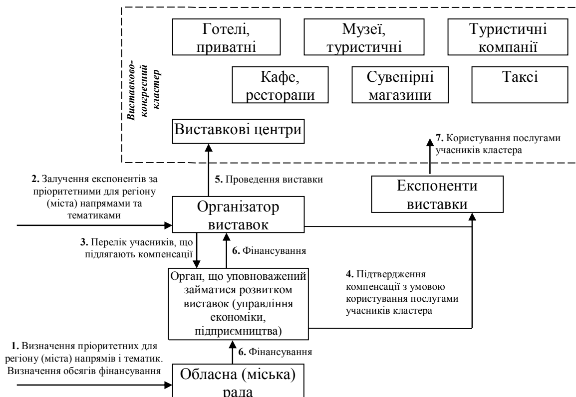
Рис. 4. Принципова схема роботи виставково-конгресного кластера з бюджетним фінансуванням; розроблено автором

Робота виставково-конгресного кластера за першим алгоритмом (рис. 4) полягає в такому: