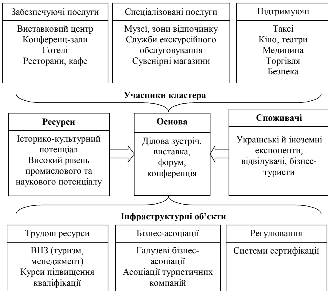
Рис. 3. Структура виставково-конгресного кластера; розроблено автором

Тому й бюджетне фінансування виставково-конгресної діяльності задля одержання мультиплікативного ефекту доцільно здійснювати через виставково-конгресний кластер. Отже, розглянемо його сутність і можливі механізми бюджетної фінансової підтримки. Досліджуваний кластер – це сконцентрована на території міста (області) група взаємозв'язаних підприємств, установ, організацій (виставковий центр, готелі, ресторани, професійні організатори конференцій, музеї, туристичні об'єкти, транспортні компанії, освітні установи та ін.), взаємодоповнюючі один одного та підсилюючі конкурентні переваги окремих компаній і кластера в цілому в процесі залучення, організації і проведення конгресно-виставкових заходів (рис. 3).