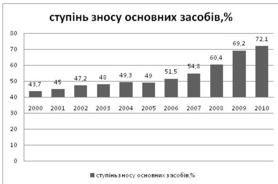
Рис. 3. Динаміка зносу основних засобів на промислових підприємствах України за період 2000–2010 рр.

Оцінка ситуації, яка склалася нині в Україні, показує, що більша частина споруд, техніки й обладнання українських підприємств зношена фізично та застаріла морально й тому вимагає заміни. За офіційними даними й експертними оцінками, більше 70% основних засобів усіх підприємств країни є застарілими (рис. 3).