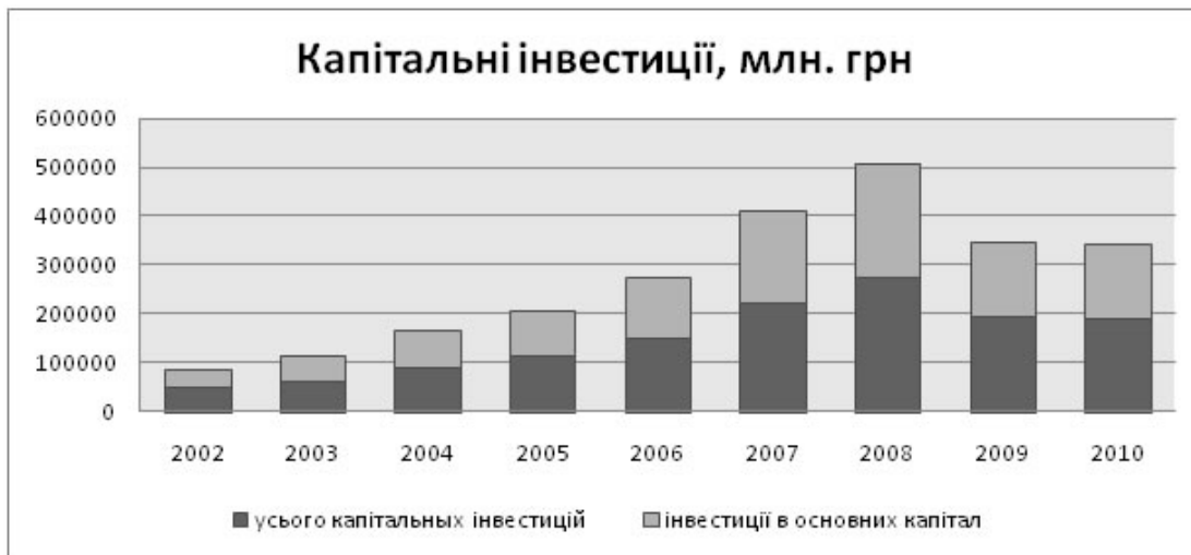
Рис. 2. Обсяг капітальних інвестицій за 2002–2010 рр. в Україні