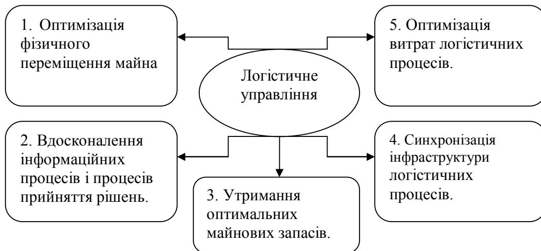
Рис. 1. Сфери логістичного управління на підприємстві [6, с. 34]

Дослідник Стефан Абт пропонує таку структуру сфери логістичного управління на підприємстві (рис. 1):