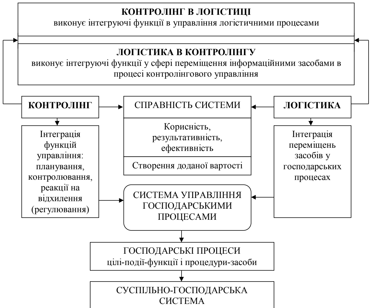
Рис. 2. Функції логістики та контролінгу в управлінні господарськими процесами [3, с. 487].

На основі досліджень інтеграції функцій логістики та контролінгу розроблено змістову модель логістичного контролінгу в управлінні діяльністю підприємства (рис. 3). Змістова модель складається з трьох блоків: блок контролінгу в управлінні діяльністю підприємства, блок логістичного управління, які формують блок логістичного контролінгу.