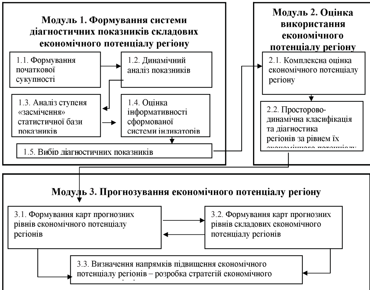
Рис. 1. Схема взаємозв'язку модулів методики оцінки і прогнозування економічного потенціалу регіону зумовлює доцільність застосування методів багатовимірного статистичного аналізу для відбору найбільш значущих індикаторів.

Цей модуль спрямований на вирішення наступних завдань: