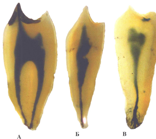
Рис.2 Препараты премоляров: А – верхний премоляр первой возрастной группы, Б – нижний премоляр второй возрастной группы, В – нижний премоляр третьей возрастной группы.

На рис. 2 представлена подборка иллюстраций, состоящая из одного первого верхнего и двух нижних премоляров, которые являются образцами трех возрастных групп. На данных препаратах хорошо видно, что пульповая камера с возрастом не подвергается столь значительной облитерации как это наблюдается у резцов, хотя имеет свои особенности. В первом препарате А, несмотря на артефакт в виде вытекшего наполнителя в области коронки зуба, мы можем наблюдать, что полость зуба в точности повторяет контуры дентина с хорошо выраженными рогами полости.