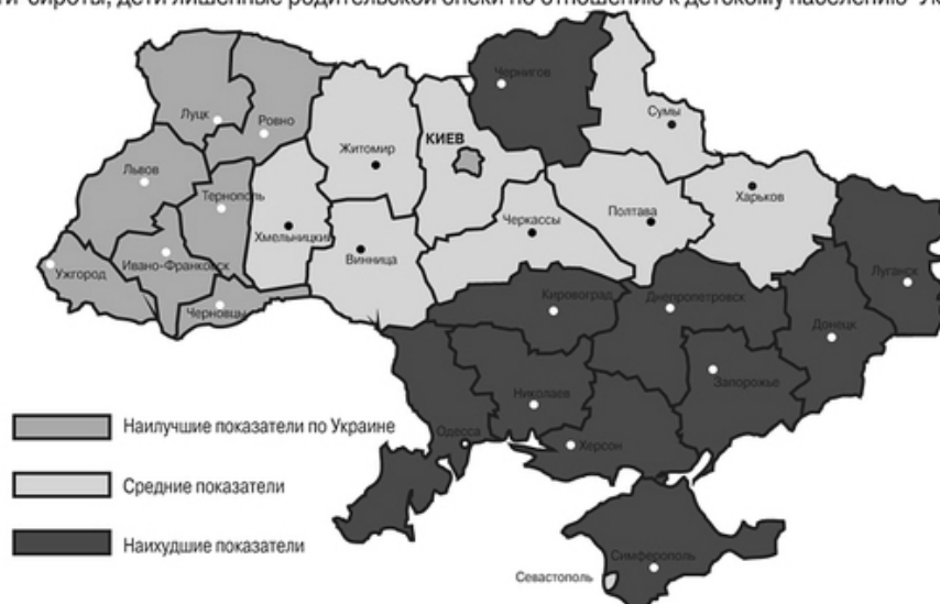
Рис. 1. Відображення показника відсотку дітей-сирот та дітей, позбавлених батьківської опіки на карті України (дані за 2010 рік)

Комунальна медична установа „Обласний спеціалізований будинок дитини” (ОСБД) м. Чернівці є комунальним закладом охорони здоров'я для медико-соціального захисту дітей-сиріт та дітей, які залишилися без батьківського піклування, дітей з вадами фізичного та розумового розвитку, а також: з органічним ураженням нервової системи та порушенням психіки; з органічним ураженням нервової системи, в тому числі, з дитячим церебральним паралічем без порушення психіки; з порушенням функції опорно-рухового апарату та іншими вадами фізичного розвитку без порушення психіки; з порушенням слуху та мови; з порушенням мови; з порушенням зору (сліпі та слабозорі). Головною метою установи є: утримання, виховання, медичне обслуговування дітей-сиріт та дітей, позбавлених батьківського піклування, віком від 0 до 3-х років (3 роки 11 місяців 29 днів включно).