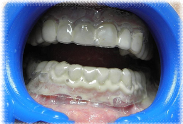
Рис 1. а - модель для виготовлення індивідуальної зубо-альвеолярної капи з валиком в ділянці шийок зубів для формування депонуючої зони (ліворуч зверху); б – індивідуальна зубо-альвеолярна капа (ліворуч знизу); в – верхня та нижні капи заповнені мультипробіотиком «Симбітер омега» в порожнині рота пацієнта (праворуч).