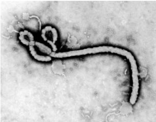
Рис. 1. Електронна мікрофотографія віріону вірусу Ебола.