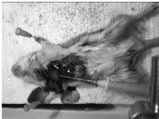
Рис. 1. Проведення перфузійної фіксації пісчанці

Більшість іноземних авторів вказують на те, що використання перфузійної фіксації є найбільш оптимальним способом збереження прижиттєвих змін в досліджуваному органі [5,6,7,9,10]. Тоді як спосіб фіксації з зануренням виділеного спірального органу в розчин формаліну не попереджує розвитку змін, пов'язаних з