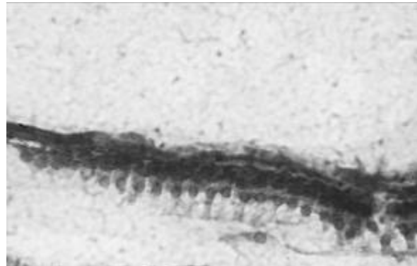
Рис. 4. Спіральний орган піддослідної тварини групи В.

Волоскові клітини на значному протязі відсутні, збережені клітини презентують глибокі дистрофічні та некротичні процеси зі зменшенням об'єму клітини, ознаками каріопікнозу. Забарвлення гематоксиліном та еозином. Зб. х 400.