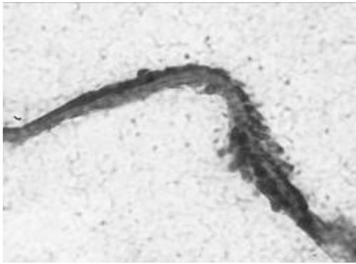
Рис. 3. Спіральний орган піддослідної тварини групи А.