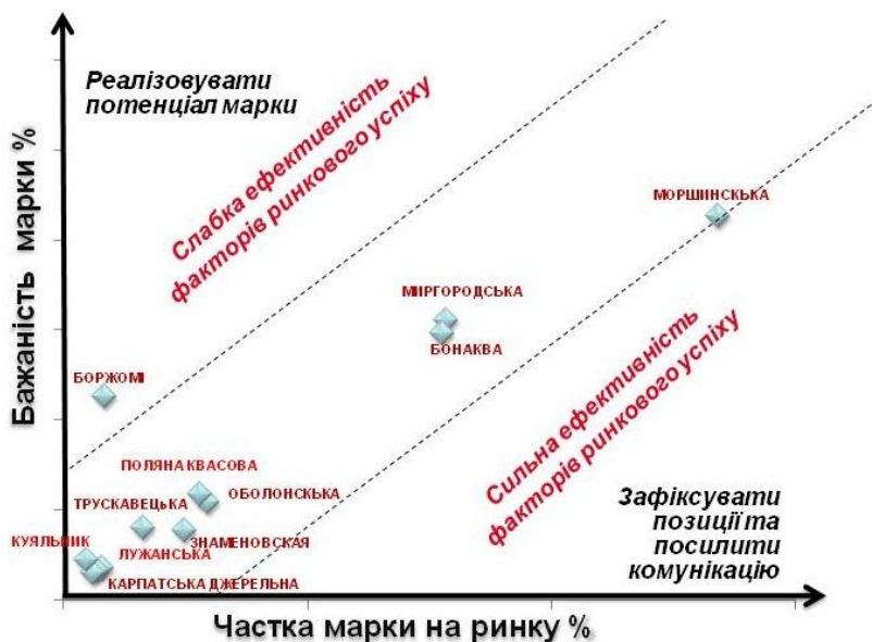
Графік 1. Результати оцінки потенціалу марок.

Таким чином, побоювання нашого клієнта підтвердились. Позиціонування в уявленнях споживачів на території «Лікування та Здоров'я» не забезпечує його маркам бажаного результату. Більш того, на цій території сконцентровано надто багато дрібних гравців (регіональних брендів). Виходячи з цього, для марок клієнта нами були розроблені декілька сценаріїв розвитку, що дозволяють повністю реалізувати їх потенціал. І зараз нам лишається сподіватися, що вони будуть успішно реалізовані клієнтом.