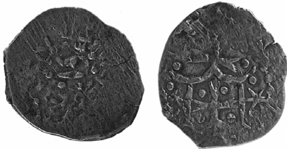
Рис. 1. Фото [I] монети князя Володимира Ольгердовича (1363–1394 рр.).

При очевидній ужитковості подібних зображень у XIV–XV ст., тема лишається відкритою і потребує залучення до вивчення знаків на київських та сіверських монетах детального розгляду і аналізу сфрагістики та геральдики ВКЛ, що має дати відповідь на питання чи можна пов'язати цю традицію не тільки з татарською, а і з литовською геральдикою. І чи не є таке явище унікальним і притаманним виключно для земель литовсько-ординського прикордоння, оскільки саме на цих територіях подібні зображення отримали певний офіційний статус у монетному карбуванні.