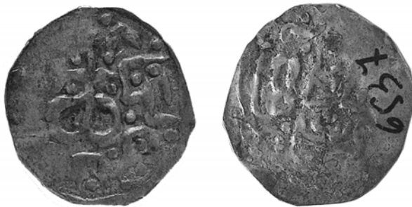
Рис. 3. Фото [II] монети князя Дмитра-Корибута Ольгердовича (1381–1404).