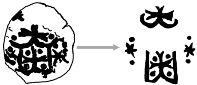
Рис. 2. Розбір знаку.