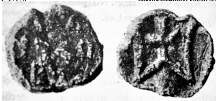
Рис. 5. Печатка Міндовга за публікацією М. Ліхачова [12, с. 247].