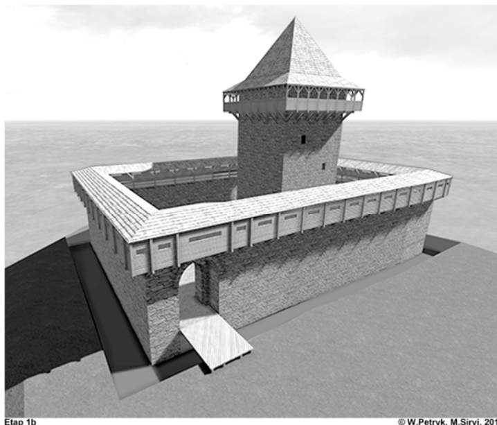
Етап 1b