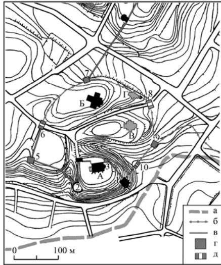
Рис. 3. Замок в Острозі в кінці XVI - першій половині XVII ст.: А - Богоявленьський собор; Б - костел Успіння Богородиці; В - Успенська церква; Г - Миколаївська церква. Умовні позначення: а - старе русло р. Грабарки; б - паркан; в - кам'яна стіна; г - башта; д - брама.