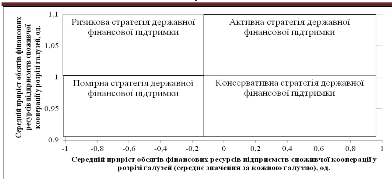
Рис. 3. Матриця конкурентного позиціонування стратегій державної фінансової підтримки розвитку споживчої кооперації за видами економічної діяльності