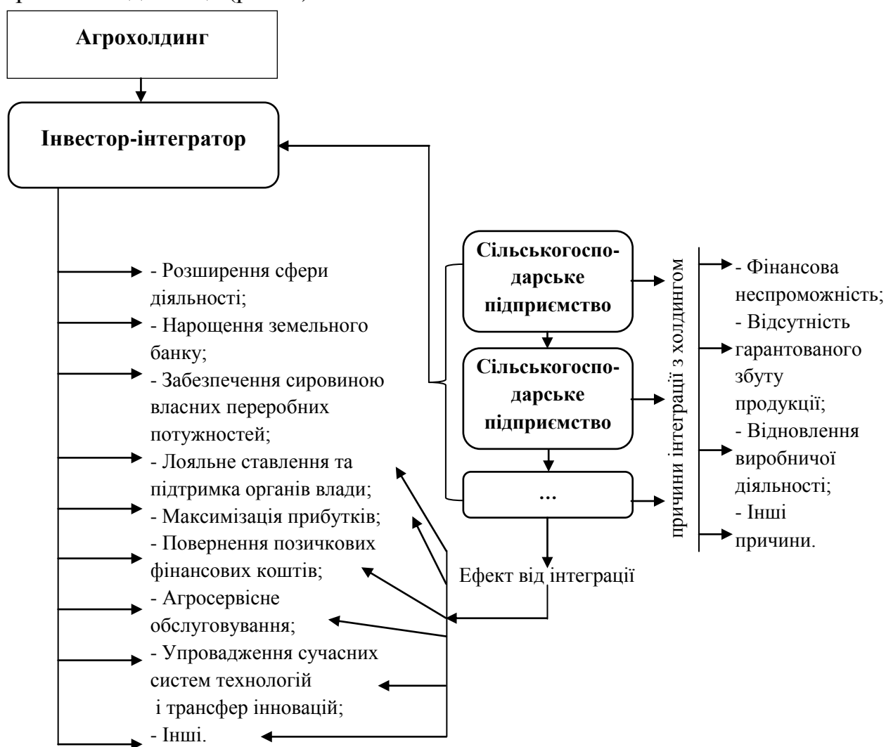
Рис. 1. Мотивація сільськогосподарських підприємств до інтеграції в агрохолдинги

На цьому етапі розвитку аграрної економіки більш вірогідними причинами «сплеску» агропромислової інтеграції й створення агрохолдингів є такі: створення сировинних зон; низька вартість сільськогосподарських земель; прагнення одержати більший прибуток на всіх стадіях виробництва сільськогосподарської продукції; повернення кредитів; лояльність і підтримка органів влади тощо (рис. 1).