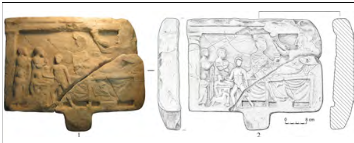
Рис. 1. Надгробный рельеф. 1 – фотография; 2 – рисунок