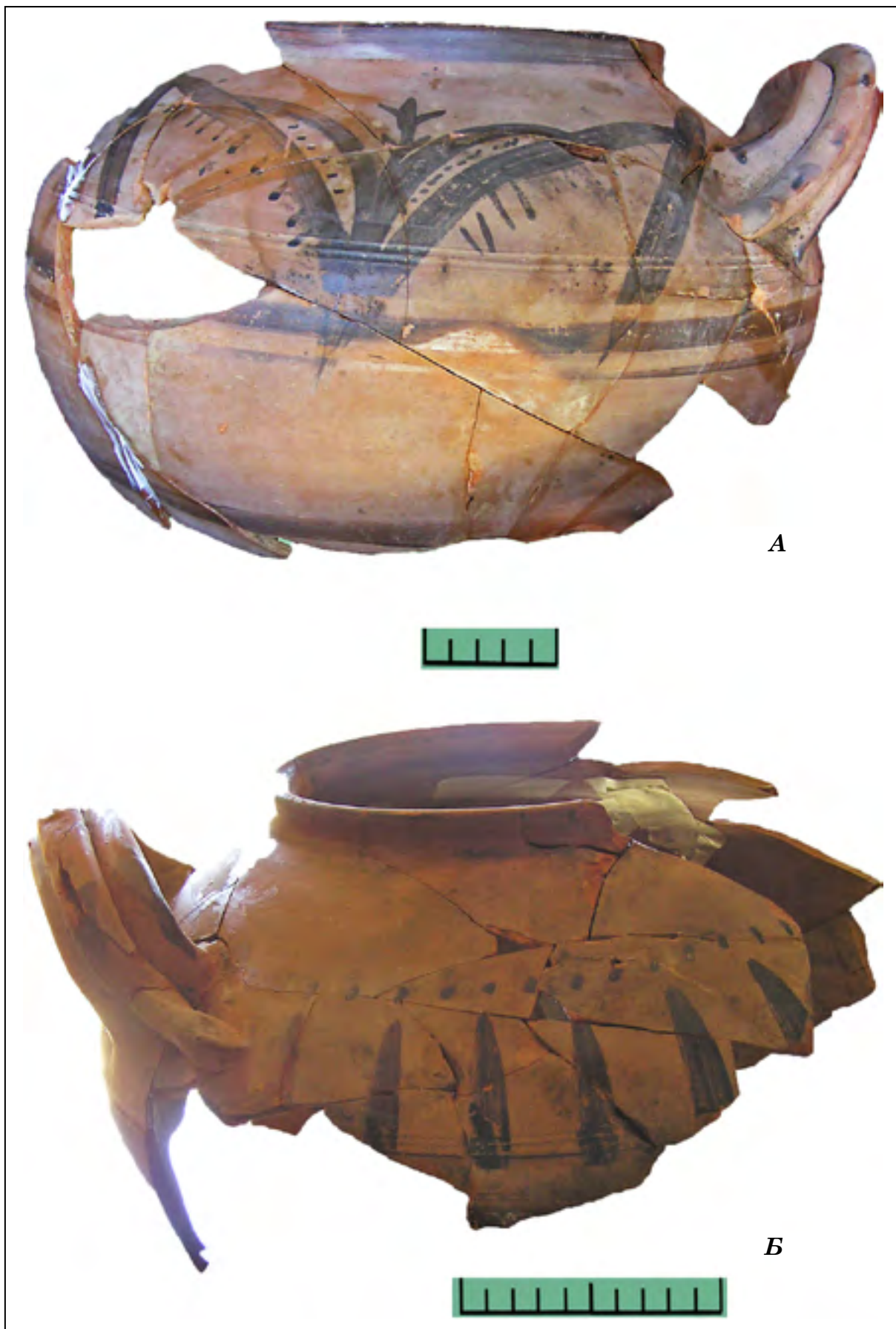
Рис. 2. Сторона А и Б