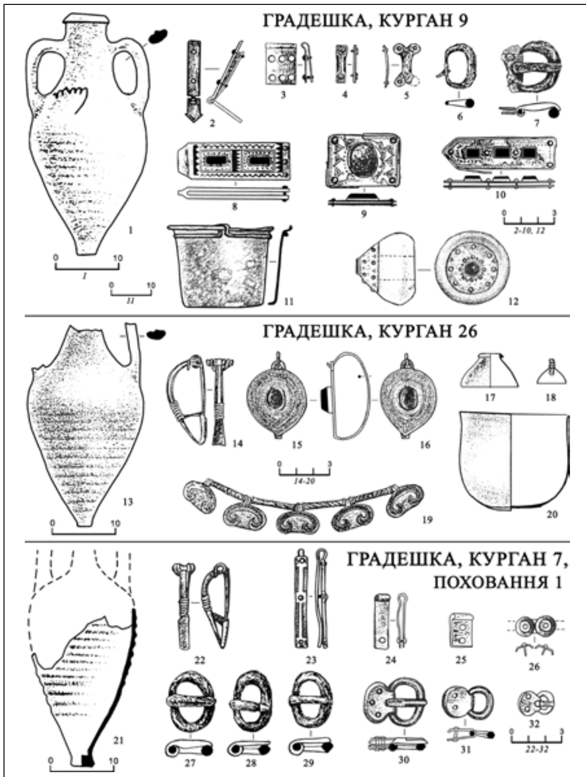
Рис. 2. Комплекси з пізніми варіантами амфор типу Шелов D: Градешка, курган 9; Градешка, курган 26; Градешка, курган 7, поховання 1 (за: Гудкова, Редина, 1999). 1, 13, 21 — амфори типу Шелов D; 2, 3, 10, 23-25 — наконечники ремінні; 4 — накладка від піхов меча; 5, 26 — накладки ремінні; 6, 7, 27-30, 32 — пряжки; 8 — щиток пряжки; 9 — бляха накладна; 11 — казанок; 12 — навершя меча; 14, 22 — фібули; 15, 16 — сережки; 17 — ворворка; 18 — дзвіночок; 19 — намисто з трубчастих пронизок та лунниць; 20 — келих; 31 — кільце з зажимом (1, 13, 21 — кераміка; 2, 3, 11, 23-25, 30-32 — бронза; 4, 5, 14, 17, 18, 22 — срібло; 6, 7, 27-29 — залізо; 8 — срібло / золото / скло; 9 — бронза / срібло / золото / сердолик; 10 — срібло / золото / сердолик; 12 — гірський кристаль / турмалін / золото; 15, 16 — золото / топаз; 19 — золото; 20 — скло).